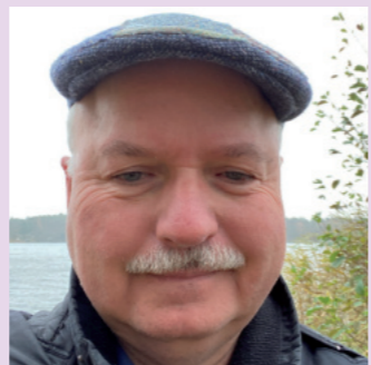
VHS Sachsenwald Raum 101

Veranstaltung des Filmrings Reinbek e.V.