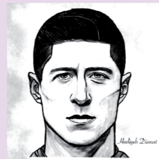
Gemeinschaftsschule Reinbek / Rathaus Reinbek

Organisiert und unterstützt von der Chopin-Gesellschaft Hamburg & Sachsenwald e.V.