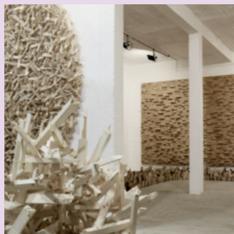
Atelier Jan de Weryha Hamburg-Lohbrügge

Eine Ausstellung des Museums der Keramiktechniken in Kolo.