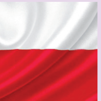
Volkshochschule Raum 101

Veranstaltung des Filmrings Reinbek e.V.