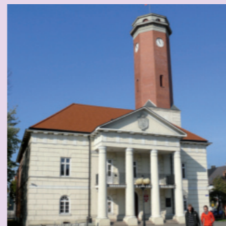
Ansicht vom Rathaus in Koło