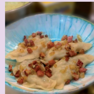
Gertrud-Lege-Schule Reinbek (Küche)

Organisiert von der GMS und unterstützt vom PaKom Reinbek