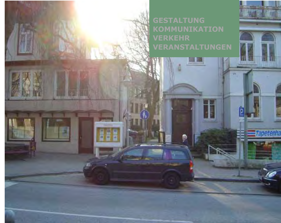
Fußweg zum Bahnhof - Schleichweg oder interessante Wegebeziehung zum Bahnhof?