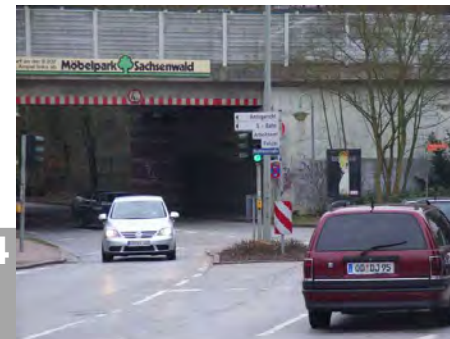
Das Tor zu Reinbeks Innenstadt ?

Im Zuge der Bahnhof-Neugestaltung hoffen wir, das der Tunnel gestalterisch überarbeitet wird.