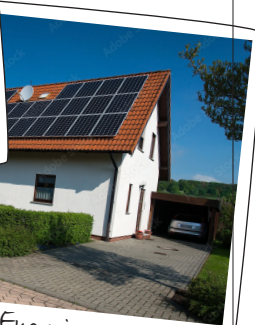
Meine Energiewende mit Zukunft und Ersparnis