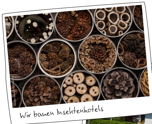
Wir bauen Insektenhotels