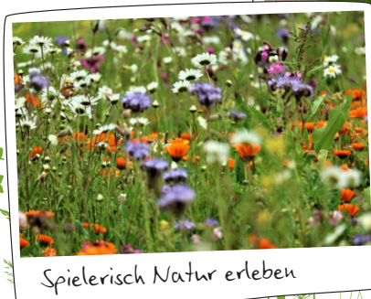
Spielerisch Natur erleben