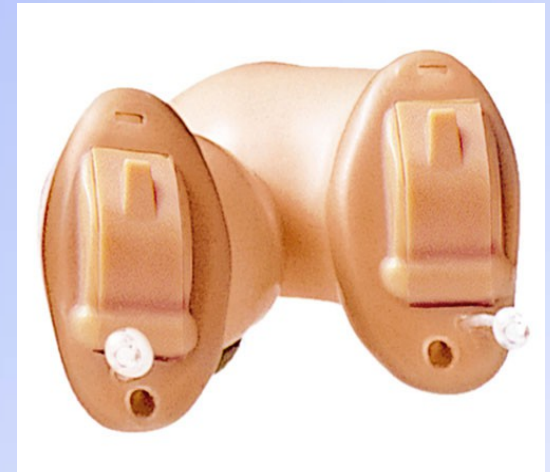
IdO – Im Ohr Geräte