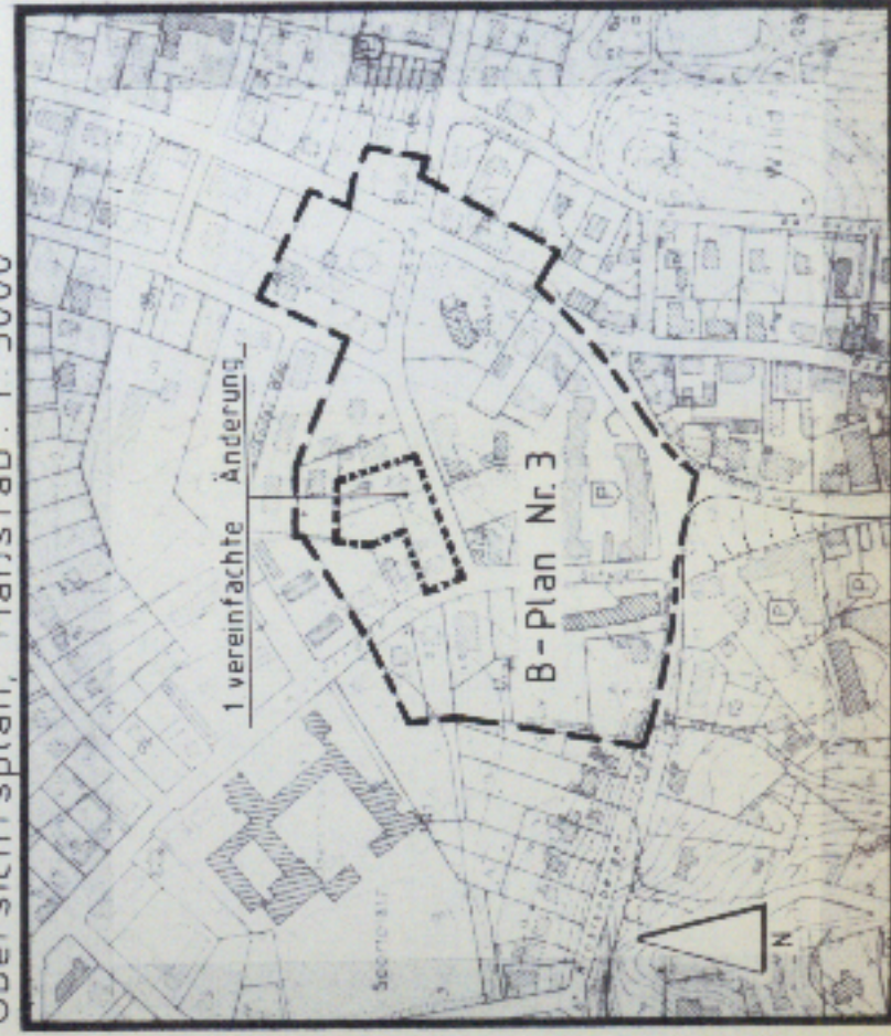
Übersichtsplan, Maßstab: 1:5000

Die textlichen Festsetzungen des Bebauungsplanes Nr. 3 vom 30.06.1975 behalten unverändert ihre Gültigkeit.